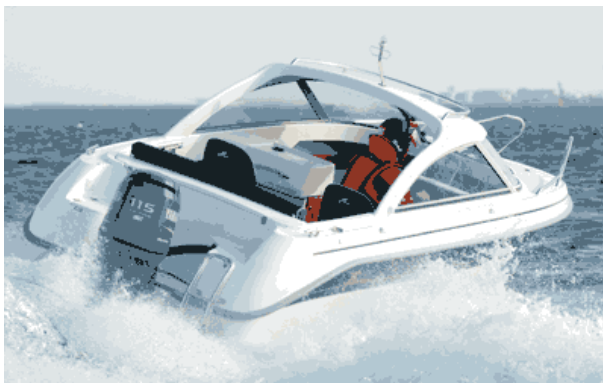
Yamarinen har super sejlegenskaber og tåler barsk svingsejlad.